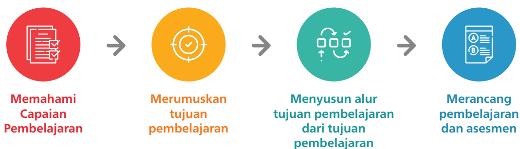
Gambar 1. Proses Perancangan Pembelajaran dan Asesmen

Memahami CP adalah langkah pertama dalam perencanaan pembelajaran dan asesmen (lihat Gambar 1 yang diambil dari Panduan Pembelajaran dan Asesmen ). Untuk dapat merancang pembelajaran dan asesmen Mata Pelajaran Bahasa Indonesia Tingkat Lanjut dengan baik, CP Mata Pelajaran Bahasa Indonesia Tingkat Lanjut perlu dipahami secara utuh, termasuk rasional mata pelajaran, tujuan, serta karakteristik dari Mata Pelajaran Bahasa Indonesia Tingkat Lanjut. Dokumen ini dirancang untuk membantu pendidik pengampu Mata Pelajaran Bahasa Indonesia Tingkat Lanjut memahami CP mata pelajaran ini. Untuk itu, dokumen ini dilengkapi dengan beberapa penjelasan dan panduan untuk berpikir reflektif setelah membaca setiap bagian dari CP Mata Pelajaran Bahasa Indonesia Tingkat Lanjut.